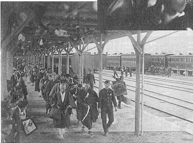
京都に到着した団体参拝者たち