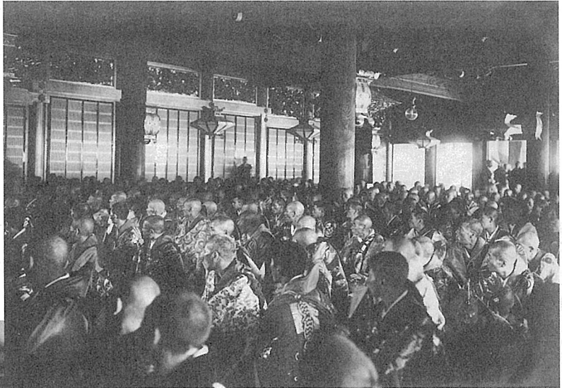
御影堂は全国からの出勤僧侶で満堂となった

礼装、毎晨朝は正装で、法要中の内陣 の莊嚴は、期間を第一期三月十六より 十八日、四月七日より十日、第二期三月 十九日より二十二日、四月十一日より十 三日、第三期は三月二十三日より二十五 日、四月十四日より十六日に分けて取り