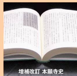
増補改訂 本願寺史